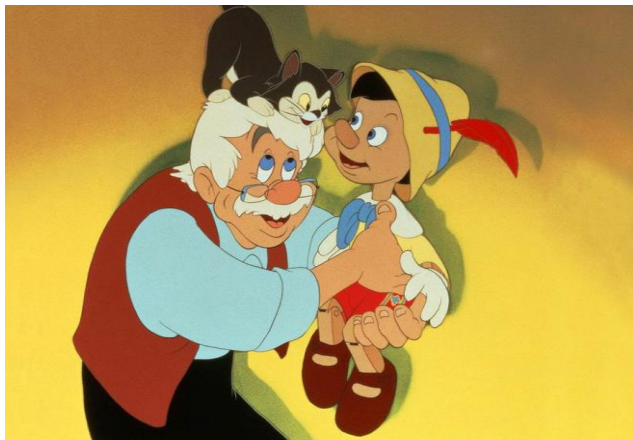
O rybaku i złotej rybce

1. Primaaprilisowy chochlik zrobił żart – pomieszał podpisy i ilustracje książek. Połącz ilustracje z właściwymi tytułami.